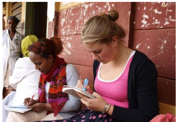
Evaluatie met een Ethiopische duo collega na een les.

In de afgelopen jaren heb ik de landen Ethiopië en de Filipijnen bezocht om daar kennis en vaardigheden uit te wisselen met lokale docenten. Dit heb ik als zeer leerzaam ervaren, zowel voor de leerkrachten daar als voor mij.