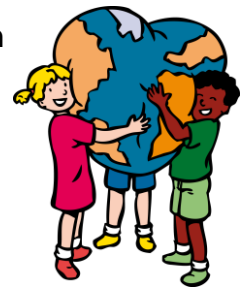
We hebben hart voor elkaar

U kunt met uw kind hier thuis goed over ‘kletsen’. Dat zou op onderstaande manier kunnen: