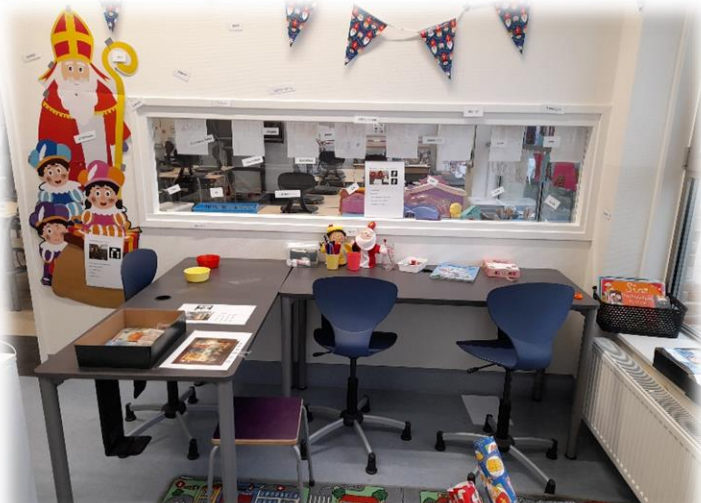
Spelend leren in de Sinterklaashoek van groep 3. Alle vakgebieden komen dmv handelingswijzers aan bod.