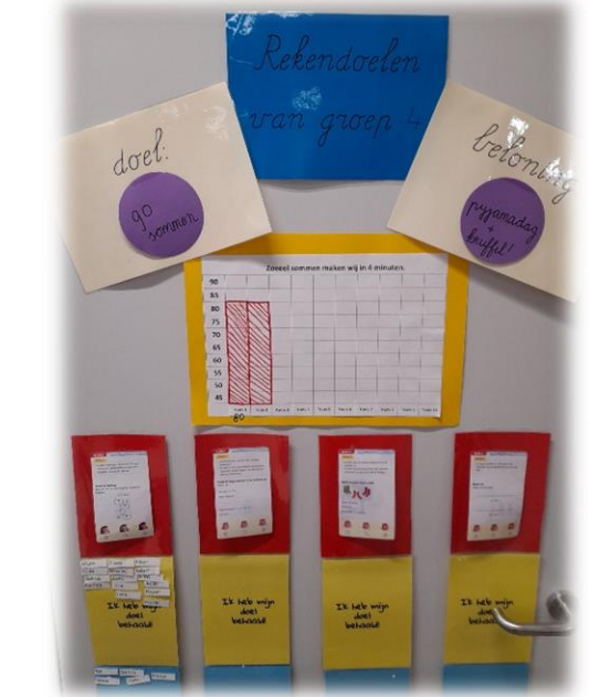
Kinderen geven per lesdoel aan wat zij hierin te leren hebben. De leerkracht past hier de lessen op aan. Zo kan er nog gericht en effectiever aan de doelen gewerkt worden.