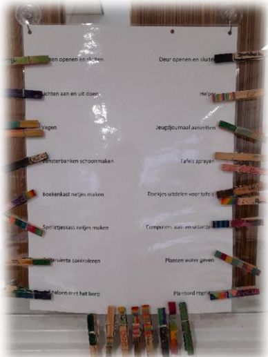
Kinderen hebben een huishoudelijk taak. We hebben allemaal verantwoordelijkheid voor de groep.