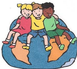
We horen bij elkaar

Tijdens blok 1 staat het samen werken aan een positief werkklimaat centraal. Naast de algemeen geldende schoolregels maken leerkracht en kinderen samen afspraken over hoe je met elkaar omgaat en over de inrichting en het ordelijk houden van de klas. Om van een school of klas een groep te maken, is het nodig dat elk kind het gevoel heeft dat hij/zij er bij hoort.