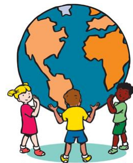
De Vreedzame School

De Oase werkt met De Vreedzame School. Met dit programma leren de kinderen om op een positieve manier met elkaar om te gaan. De kinderen leren op een democratische manier beslissingen te nemen en een actieve bijdrage te leveren aan de sfeer en de gang van zaken in de groep. Dit bevordert niet alleen het plezier waarmee uw kinderen naar school gaan, maar zorgt ook voor een werkklimaat waarin veel geleerd kan worden.